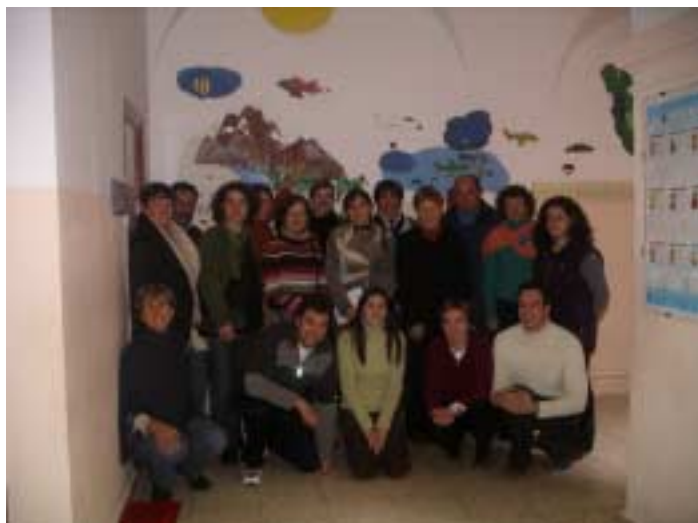
Le groupe Val d'Adour avec l'équipe éducative du CRIET

Nous sommes donc partis de l'autre côté des Pyrénées et nous (11 personnes de la commission : Parent, enseignante, animatrices, responsable enfance, assistante sociale, orthophoniste, élus locaux) avons passé quatre jours dans le Maestrazgo (Province de Teruel) où nous avons été accueillis très chaleureusement par les différentes structures que nous avons souhaité rencontrer pour un programme dense riche en découvertes et réflexions, ce mois de décembre.