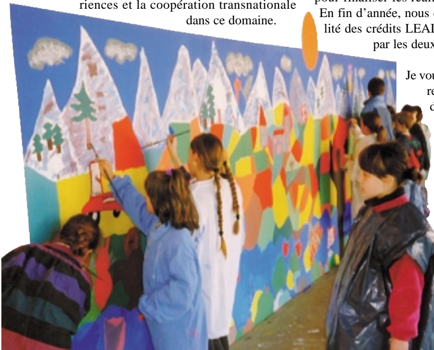
Conception, réalisation : Isabelle CRAMA Infographie

Nous avons aussi engagé des actions structurantes dans le cadre de la coopération transnationale avec nos amis partenaires luxembourgeois, le GAL Redange-Wiltz. C'est ainsi qu'à travers toutes ces actions, nous sommes dans le respect absolu des règles du programme d'initiative communautaire LEADER II. Le programme a été décidé dans l'optique de favoriser une politique globale de dynamisation d'un territoire rural (le Val d'Adour) en soutenant des projets innovants menés par des groupes d'action locale (le GAL EURADOUR) et en encourageant l'échange d'expériences et la coopération transnationale dans ce domaine.