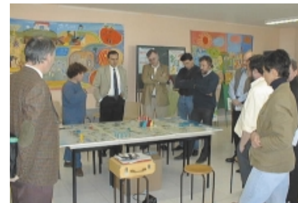
«La coopération transnationale»

Engagée depuis Décembre 98, notre démarche de coopération transnationale commence à porter ses fruits grâce aux initiatives du syndicat d'Aménagement de la Région de Marciac, de l'Association Soleil et du CPIE Bigorre Pyrénées. Ainsi, c'est un nouvel échange avec nos partenaires Luxembourgeois qui a eu lieu dans le Val d'Adour au cours du mois d'Août.