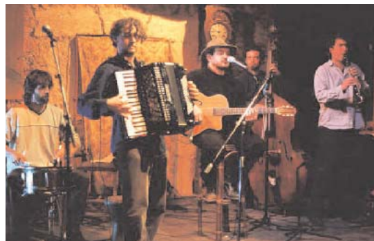
Le chauffeur est dans le Pré

La cuisine du Chou vous est ouverte pour nous communiquer vos événements : contact rédaction: Stéphane Chalan s.chalan@val-adour.com - 05 62 96 44 88