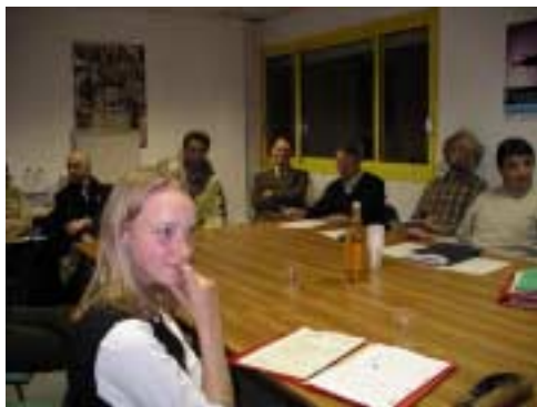
H. L. Collège de Marciac, Conseil de Développement