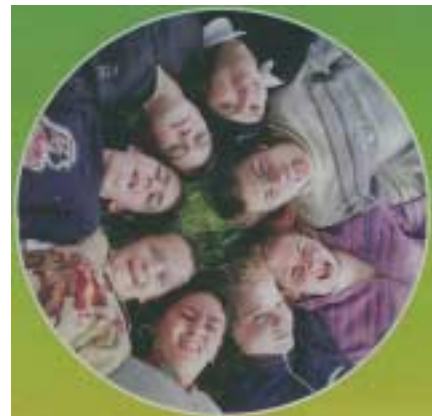
Comité de rédaction du S. pot mag 04