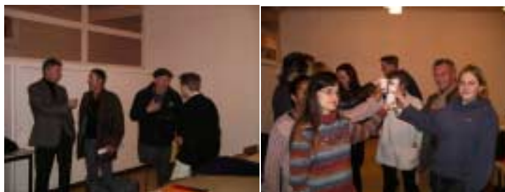
Réunion du comité de pilotage, collège de Plaisance

Sa fréquentation : A ce jour, les 6 des 7 collèges impliqués dans le CLJVA sont régulièrement représentés ainsi que la JS et la plupart des associations d'éducation populaire partenaires. Les élus sont souvent présents. Les fédérations de parents sont rarement au rendez-vous. Il y a toujours un petit groupe de jeunes avec un noyau « dur » de 5-6 éléments. Un effort permanent est à faire pour la mobilisation des jeunes au sein du comité et l'implication des parents est à encourager.