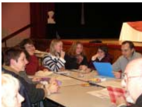
Réunion du CLJVA