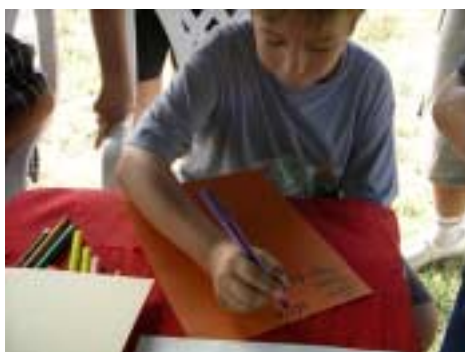
Atelier calligraphie , découverte du cyrillique